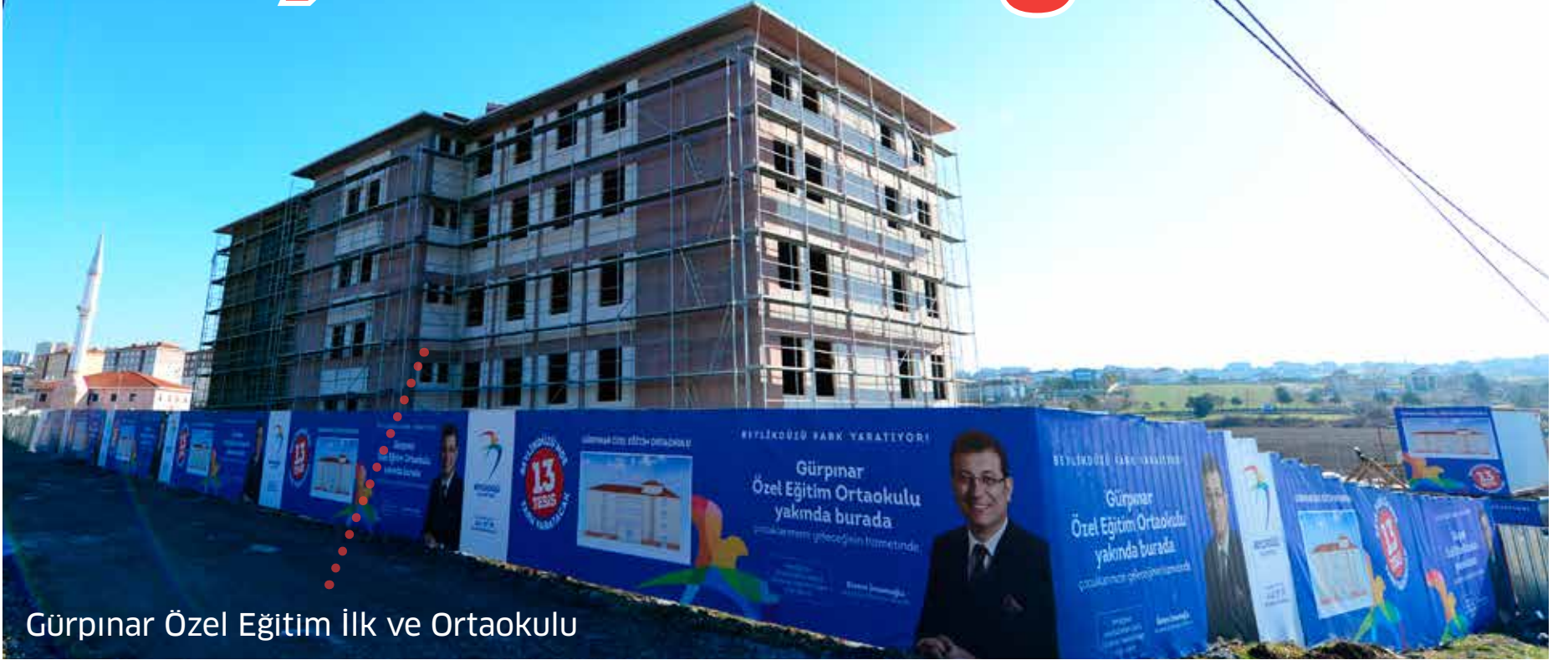
Gürpınar Özel Eğitim İlk ve Ortaokulu